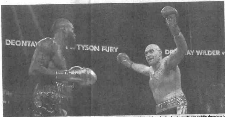
Gledatelji su mogli uživati u fantastičnoj i bespoštednoj borbi u kojoj su obojica imala svoja razdoblja dominacije

Premda je tehnički nadvisio dosadašnjeg prvaka Deontaya Wildera, britanski teškaš Tyson Fury nije osvojio WBC-ov pojas. Doduše, britanski izazivač dvaput je bio na podu (u devetoj i 12. rundi), ali ni američki boksač nije pobijedio. No prvaku je i remi bio dovoljan da zadrži svoj naslov, a Furyju je ovakva predstava pak bila dovoljna da stekne pravo za uzvrat. Britanac se doista jako dobro kretao, još bolje eskivirao, ali samo do devete runde kada je eskivirao saginjanjem, a ne izmicanjem pa ga je pogodila jedna Wilderova bomba. Nešto slično dogodilo se i u posljednjoj rundi,