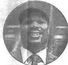
LENNOX LEWIS smatra da je Fury trebao dobiti ovu borbu. Prema mišljenju bivšeg prvaka njegov sunarodnjak bio je bolji od Wildera